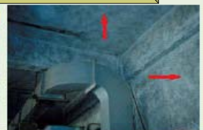
天井アスベスト、石棉含有天井ロックウール（換気用）