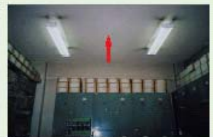
石棉含有パーキユライト天井（天井）