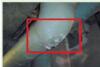
石棉含有保溫材（配管回り用）