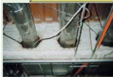
天井アスベスト、石棉含有天井ロックウール（5造の耐火被覆）

なお、建設工事等で、新たにアスベストを含む建築材料が使用されることはありませんが、 今後も石綿建材を使用した建築物等の解体や補修工事等が増加することが見込まれているため、これらの工事が行われる際には、飛散防止の徹底を図ることが重要です。