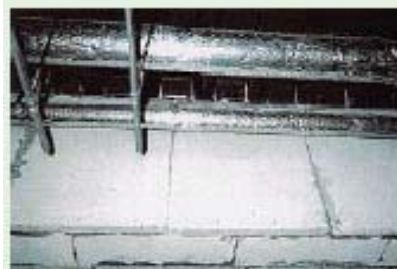
石棉含有ケイ酸カルシウム板（2種）（5造の耐火被覆）