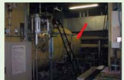
石棉含有保溫材（ボイラ外周部）

引用：「建築物の解体等に伴う有害物質等の適切な扱い」建設副産物リサイクル広報推進会議